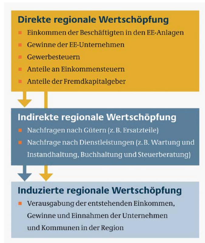
Abb. 1: Schema direkter und indirekter Wertschöpfungseffekte Erneuerbarer Energieanlagen

Im Folgenden werden zwei Themen in den Blick genommen, die einen direkten Bezug zum Infrastrukturwandel auf regionaler/lokaler Ebene haben und deren Bearbeitung auch Konsequenzen für die soziale Kohäsion im weiteren Sinne haben – so die hier vertretene These: eine hohe Bedeutung in der sozial-ökologischen Perspektive.