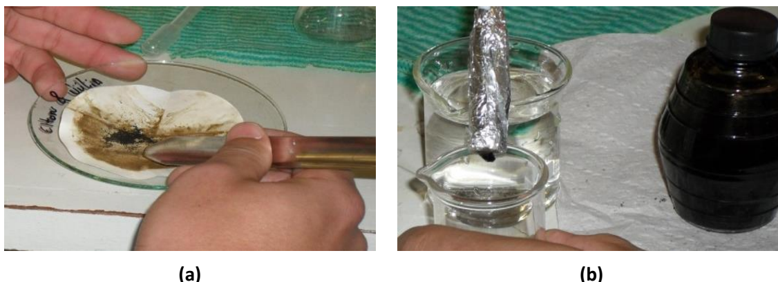
Figura 2. a) Preparo do material magnético. (b) Simulação da remediação de corpos d'água impactado por derramamento de petróleo