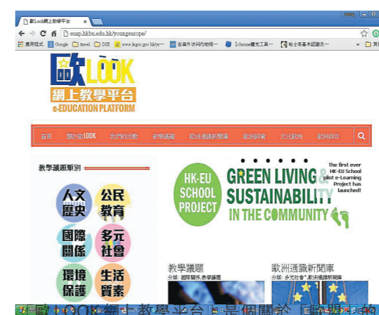
「歐LOOK 網上教學平台」是個關於「歐洲」的網站，內容正好與通識教育相關。

「全球化」單元總會接觸到「歐盟」此組織。歐盟多國同學均耳熟能詳，而且這些國家多與香港、中國有緊密聯繫，也同樣是「今日香港」、「現代中國」單元的「常客」。其實歐盟多國與「可持續發展」、「公共衛生」相關的資訊也是學習的好素材，可作跨單元學習。