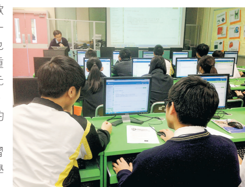
參加的同學正在使用網上教學平台「Blackboard」

同學可多瀏覽「歐LOOK 網上教學平台」，一方面了解歐盟，另一方面也可加強對網站內容涉及的重要議題，如公民教育、多元社會、環境保護等的認識。除此之外，設計這個網站的機構「香港歐盟學術計劃」也會舉辦一些有意義的學習活動，其中一個運用電子學習。