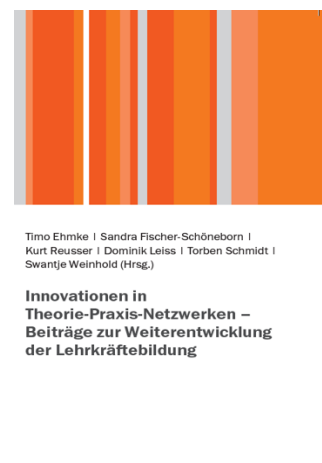
Abb. 1: ZYL-Sammelband

Im Rahmen der Veröffentlichung des ZYL-Sammelbandes sind auch jeweils ein Poster der acht Entwicklungsteams entstanden sowie eine „Landkarte“ zur Vernetzung des ZYL-Netzwerks