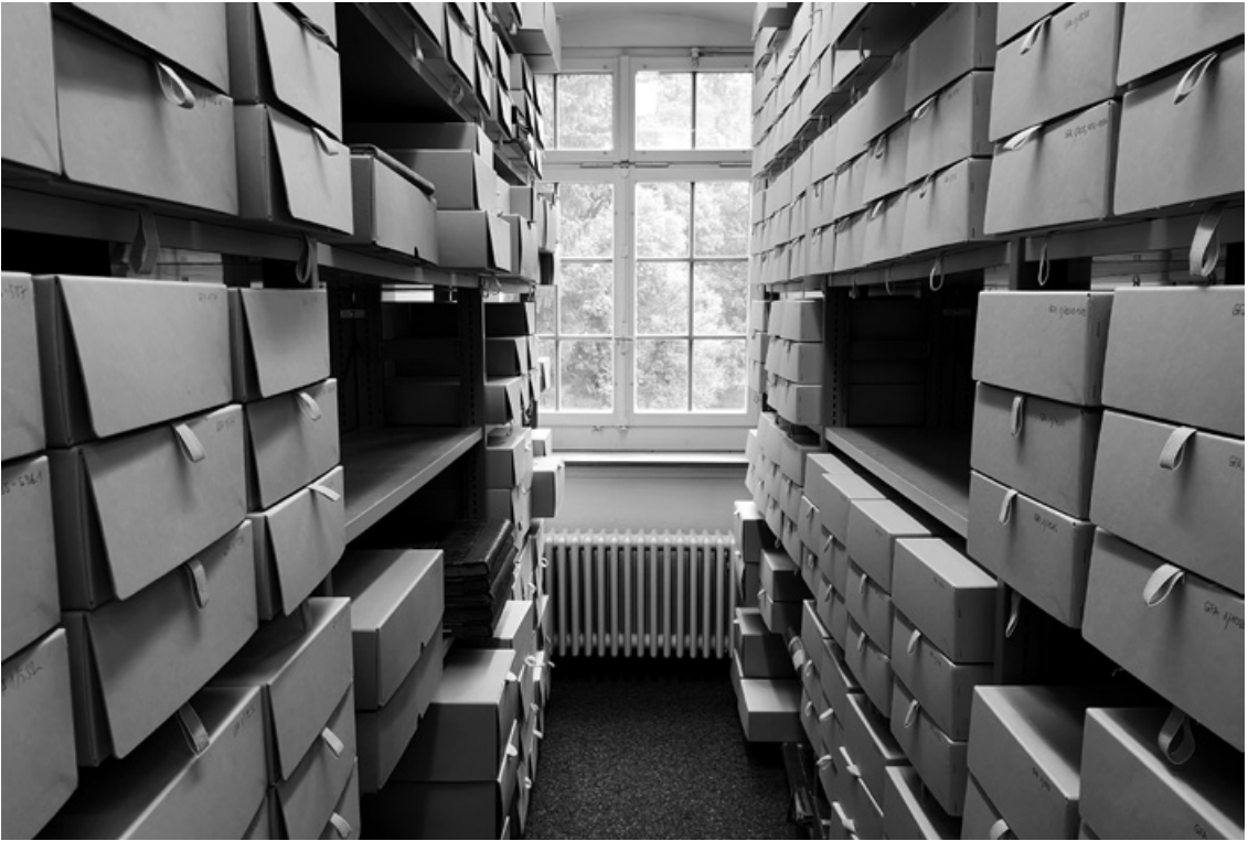
Abb. 1 Blick in Regale des Konzernarchivs der Georg Fischer AG Schaffhausen, Juni 2019, Arbeitsplatz einer unserer Gesprächspartnerinnen