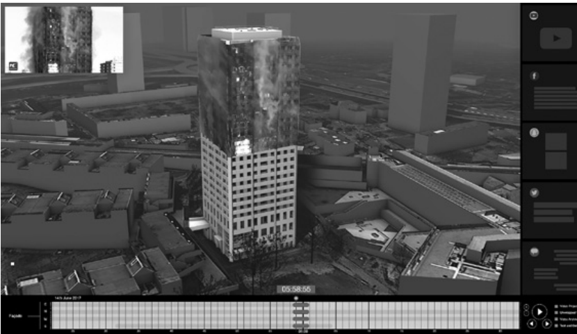
Abb. 1/2 oben Prototyp für ein <3D-Video> zur Analyse des Brands: Mapping und Projektion von Videomaterial auf ein Modell des Grenfell Tower mit navigierbarer Zeitleiste und Zugriff auf dokumentierte Kommunikationsvorgänge. unten Alternative Ansicht mit perspektiviertem Videomaterial ( texture projection ).