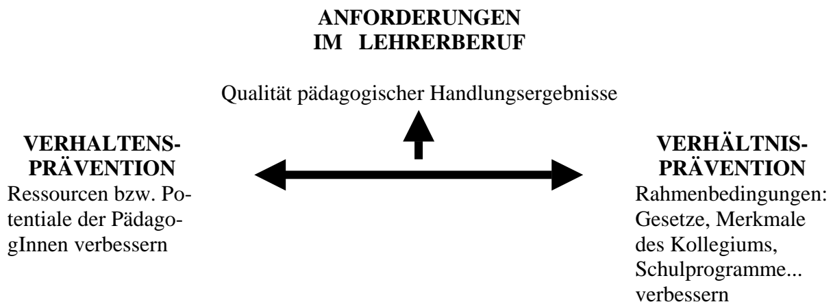
Abb. 1 Qualitätsverbesserung durch eine bessere Balance zwischen Anforderungen, persönlichen Potentialen und institutionellen Rahmenbedingungen

Wer die Qualität einer Schule verbessern will, muss an einer besseren Balance dieser drei Faktoren arbeiten: d.h. Anforderungen den Möglichkeiten anpassen, bzw. Rahmenbedingungen oder Potentiale der einzelnen PädagogInnen verbessern.