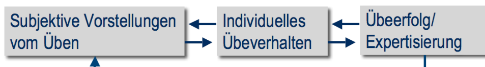
Abbildung 1: Wirkzusammenhänge zwischen subjektiven Vorstellungen vom Üben, Übeverhalten und Übeerfolg

Auf dem Gebiet der Lernforschung ist nicht nur der Zusammenhang zwischen globaler Lernorientierung und den angewendeten Strategien bekannt, sondern auch ihr Effekt auf die Lernergebnisse gezeigt worden (Marton/Säljö 1976a, 1976b). Auf der Grundlage der Ergebnisse von Cantwell und Millard (1994) kann vermutet werden, dass die zwei globalen Lernorientierungen mit den gewählten Übestrategien beim Erlernen eines neuen Musikstückes korrelieren. Hallam (1995b) geht in ihrer Studie noch einen Schritt weiter und formuliert in Anlehnung an Sloboda (1985) globale Orientierungen des Übens. Die 22 zu ihrem Übeverhalten beim Erlernen und Interpretieren eines neuen Stückes befragten professionellen Musiker/innen werden gemäß ihrer Interviewaussagen in die drei Kategorien einer ausschließlich technischen, einer ausschließlich musikalischen und einer beide Aspekte umfassenden Orientierung eingeordnet (Hallam 1995b). Bei einer musikalischen Orientierung zeigt sich im Interview, dass beim Üben die Analyse von Musik und die Aneignung von musikalischem Wissen statt das Erlernen von Technik im Vordergrund stehen. Eine technische Orientierung zeichnet sich durch die Betonung des Übens von Etüden und von technischen Aspekten aus. Bezeichnenderweise wurde auch in dieser Untersuchung ein struktureller Zusammenhang zwischen den erhobenen Übestrategien und den soeben beschriebenen globalen Orientierungen des Übens gefunden.